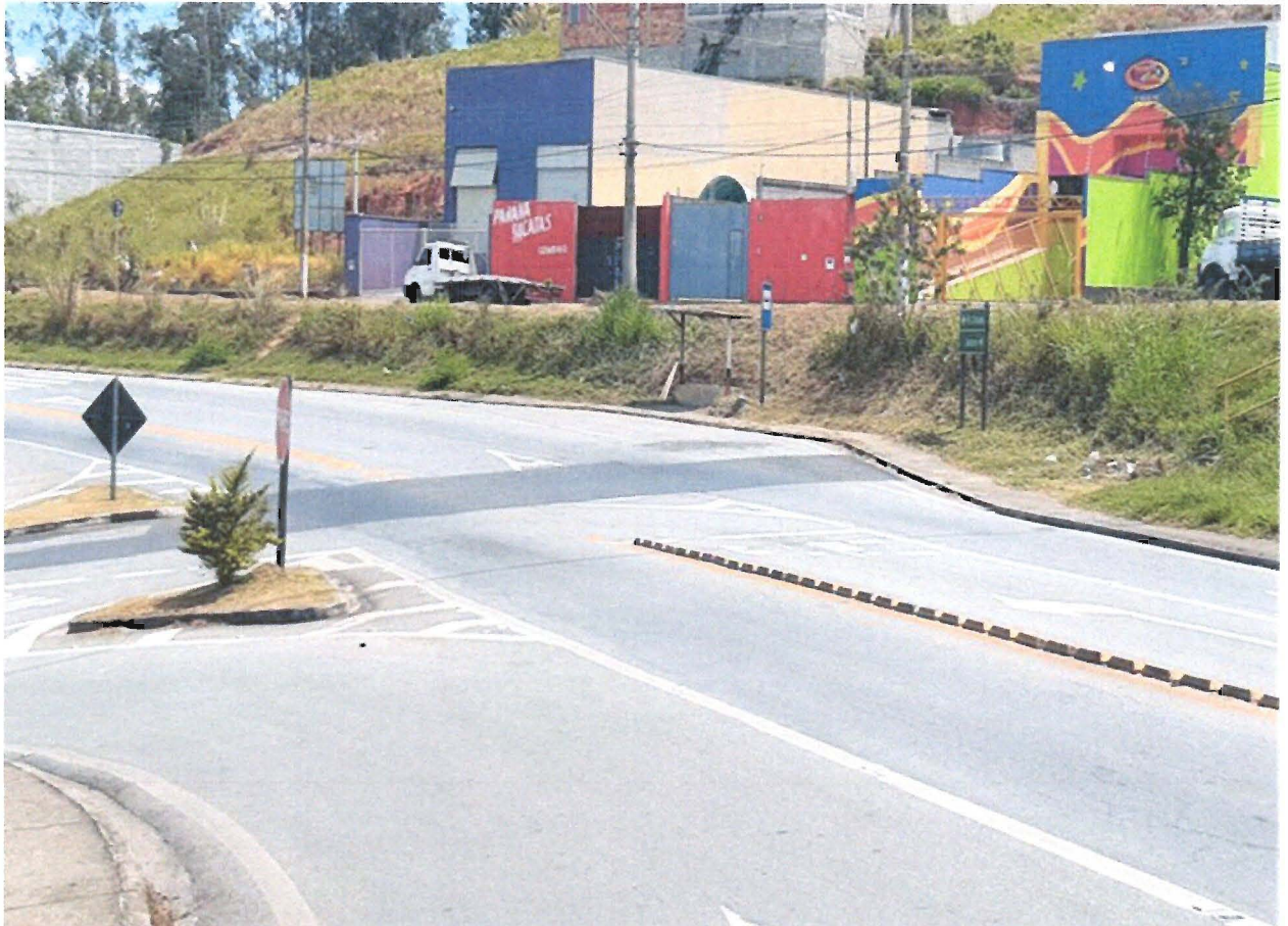
FOTO: Rodovia General Euryale de Jesus Zerbine, região de acesso ao Bairro Bandeira Branca I, em Jacareí.

Requerimento nº 374/2019 - PAULINHO DO ESPORTE - fls. 2/2